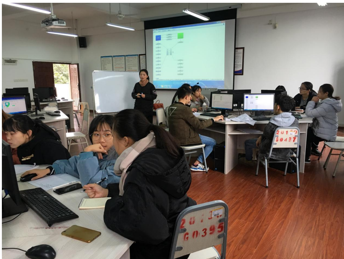
职业技能竞赛-参加各级竞赛