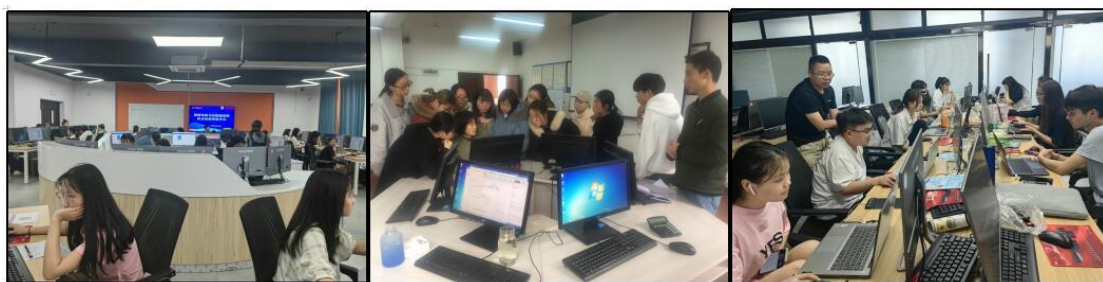
图2 分流三场域实践

X证书团队则是针对那些希望获得专业资格证书的学生而设立的。学院会根据学生的兴趣和需求，为他们提供相应的职业资格证书培训和辅导。学生可以通过考取这些证书，提升自己的职业竞争力和市场认可度。