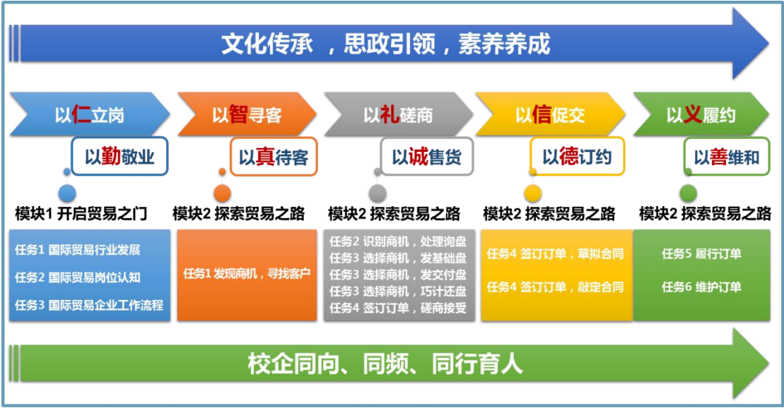
图3 三同共育示意图

在具体实施层面，本课程采取了以下策略：首先，将中华优秀传统文化中的“仁义礼智信”融入教学体系，运用案例教学、情境模拟等多元化教学手段，有效加强了思政教育。其次，将企业的真实工作任务引入课堂，让学生在了解企业的实际需求和 workflows 的过程中，提升了实务操作技能，还树立了正确的价值观。最后，课程特别注重提升学生的团队协作能力、沟通能力、问题解决能力、职业道德以及创新能力等职业素养，为学生未来的职业生涯发展提供了强有力的支持。