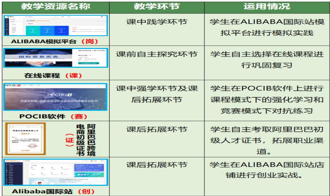
图 4 课程使用的数字化资源

化平台还提供了丰富的互动功能，如在线讨论、答疑等，增强了师生之间的互动和交流。此外，数字化平台还具备强大的数据分析能力，可以帮助教师实时掌握学生的学习进度和效果，为个性化教学提供有力支持。